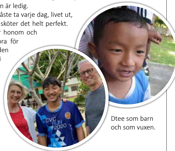
Dtee som barn och som vuxen.

Medicinen han måste ta varje dag, livet ut, är gratis och han sköter det helt perfekt. Vi är så glada för honom och att det gått så bra för honom, trots den jobbiga starten i hans liv. En riktig överlevare. Det var ett kärt återseende när vi träffade honom. ■