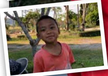
Nya barn! sid 3