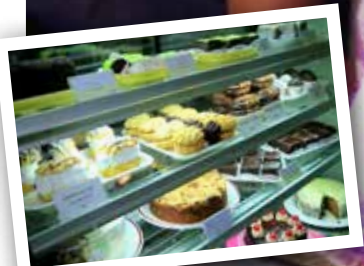
BCM Bakery SID 4